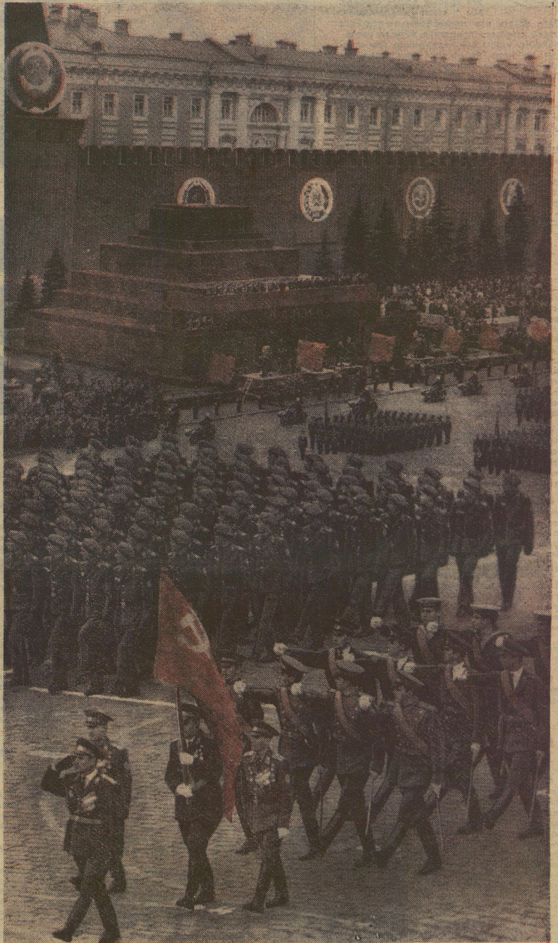
Герои Советского Союза М. ЕГОРОВ, М. КАНТАРИЯ, К. САМОНОВ водрузили Знамя Победы над рейхстагом. 1 Мая 1970 года они пронесли это знамя по Красной площади.

Ещё раз внимательно посмотри на фотография. Знамя Победы. Это знамя — символ мужества нашего народа. Красный цвет этого знамени на твоей груди. Будь таким же смелым и честным, как твой дед или отец, которые шли к победе под этим знаменем.