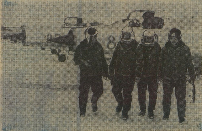
Военные лётчики. Они только что участвовали в самом современном воздушном бою — перехвате.

Перехват — это новый вид боя, гарантирующий мир нашим городам и нашему небу. Как и в дни Великой Отечественной войны, этот бой требует от лётчиков не только мастерства и высокой техники пилотажа, но и мужества, храбрости, большой ответственности перед страной, которую они охраняют.